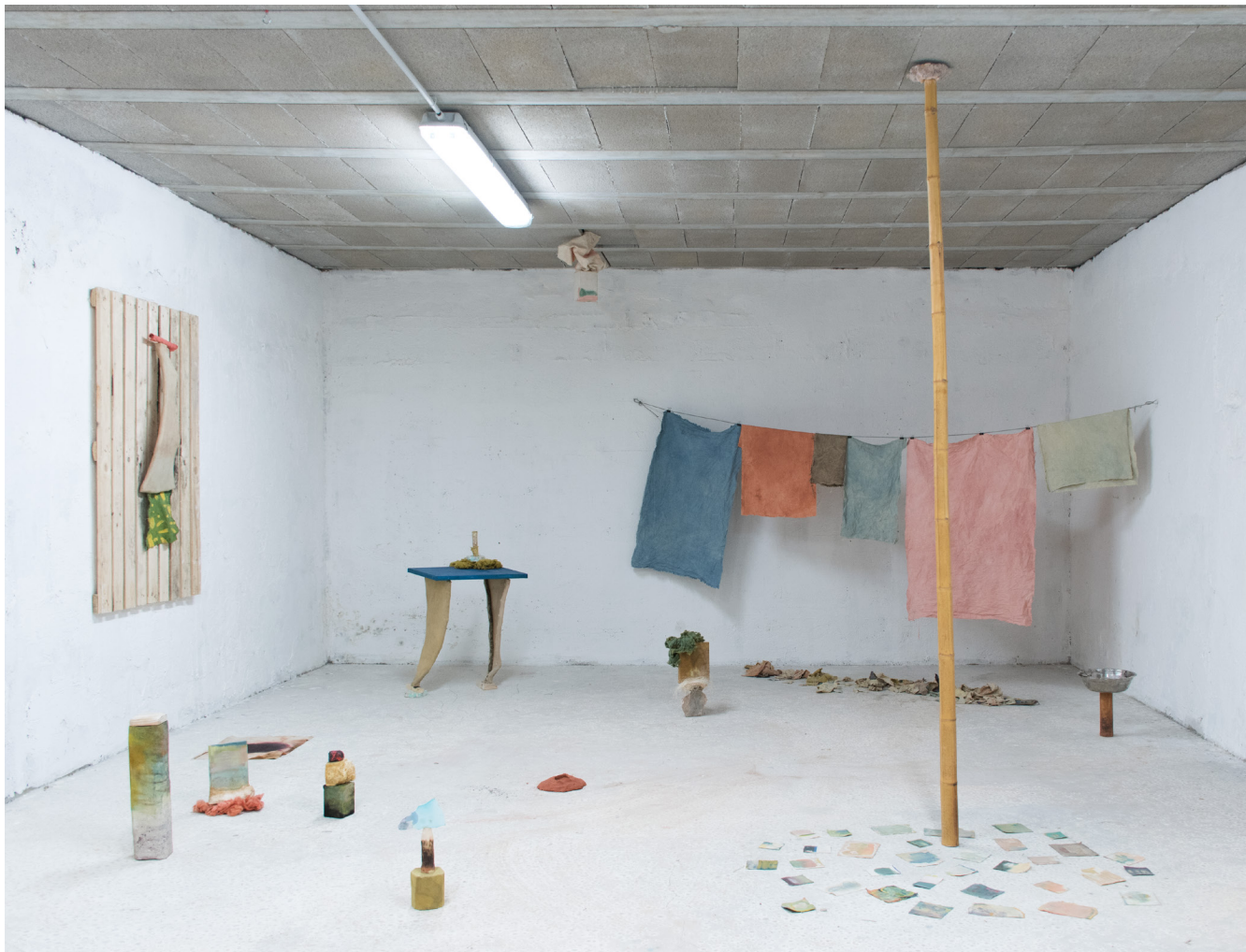
Un paysage de peintures N° 11 (絵の風景 No.11) 2019年 / 草木染め等のミクストメディア / マルセイユのアトリエにてインスタレーションの風景 / 仏